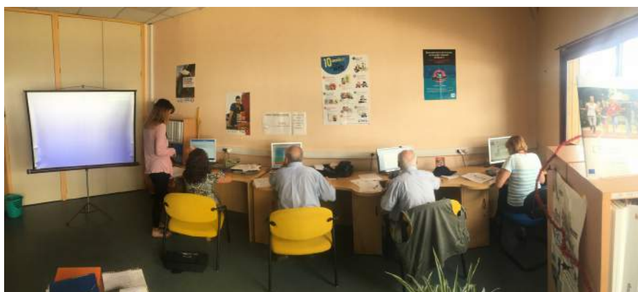
Rapport d'activités 2017

Comme d'autres acteurs intervenant dans le cadre de la politique de la ville, il apparaît que le public est difficilement mobilisable. Un travail en amont et en aval de l'action avec les différents acteurs présents sur les quartiers semble être un aspect à renforcer pour l'année prochaine.